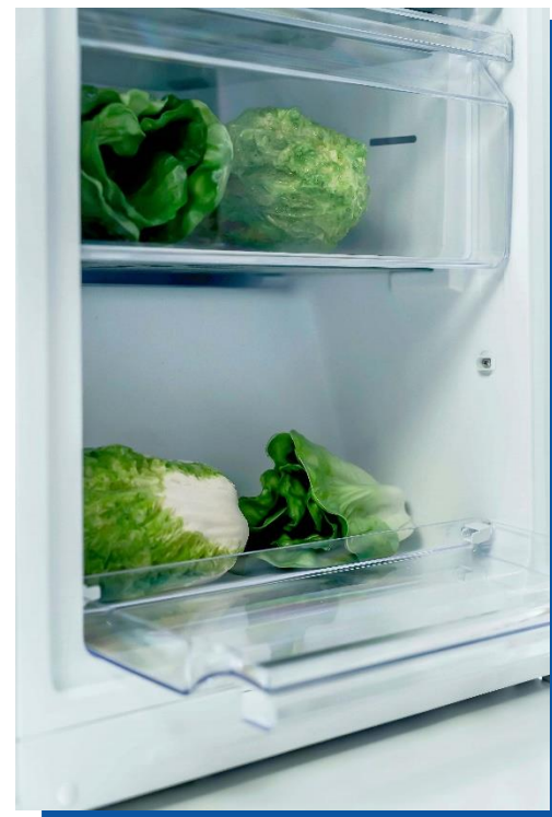
ПРОЧНЫЕ ПРОЗРАЧНЫЕ КОРЗИНЫ