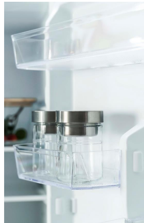
РАЗДЕЛЕННАЯ ПАНЕЛЬ ДВЕРИ ХОЛОДИЛЬНОЙ КАМЕРЫ