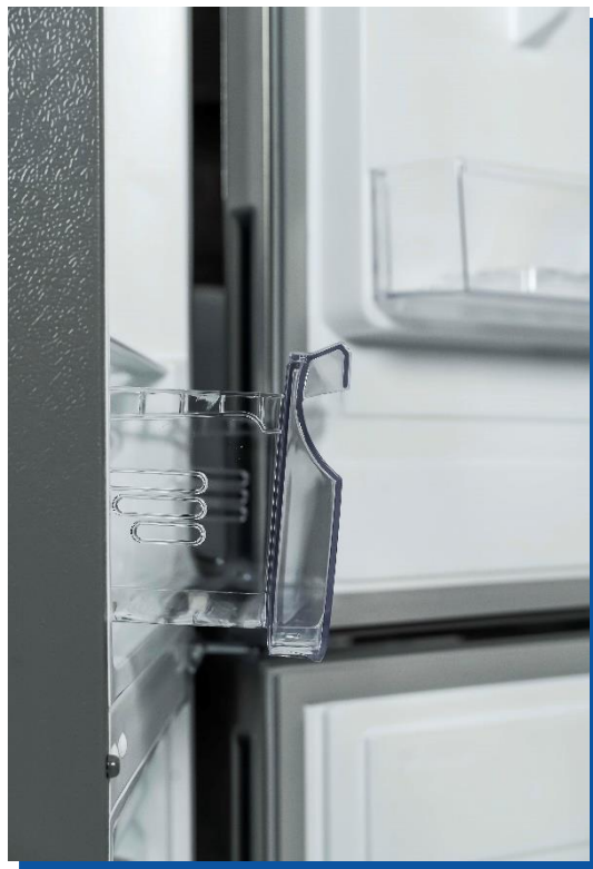
ПОКРЫТИЕ НЕРЖАВЕЮЩАЯ СТАЛЬ